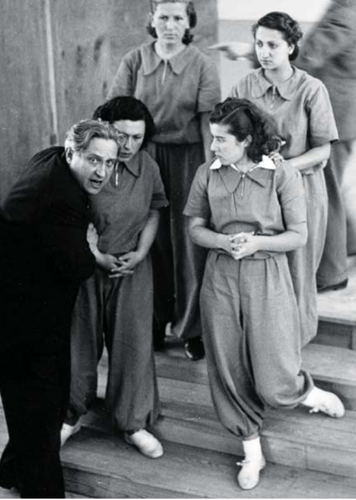
1937 in Ankara, Türkei